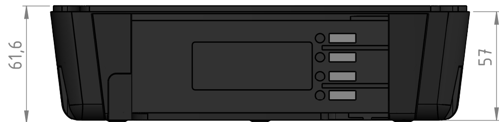
Nano-minor/media Unterteil Version 7,2V TNr.: 2.250.1655